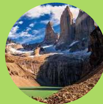
Las torres del Paine

Se estiman otras 30.000 especies en estado vulnerable o en peligro de extinción