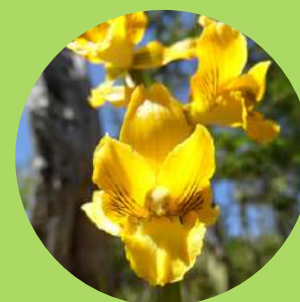
Orquídea Amarilla de Nahuelbuta