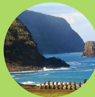
Isla de Pascua