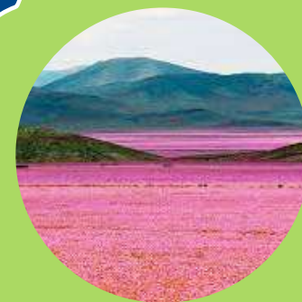
Desierto Florido de Atacama