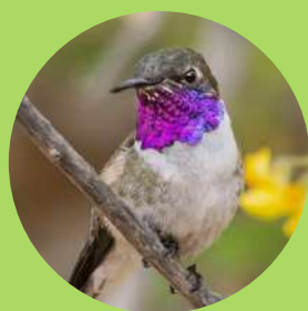
Picaflor de Arica