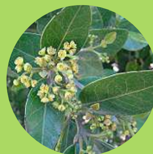
Belloto del Sur

Fuente: Lista Roja de Especies Amenazadas (UICN, 2022)